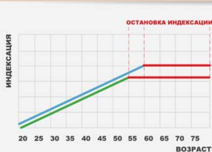
Заморозка перерасчета пенсии

2 Ежегодный перерасчет пенсий для работающих пенсионеров должен быть сохранен, либо должна быть предложена справедливая альтернатива.