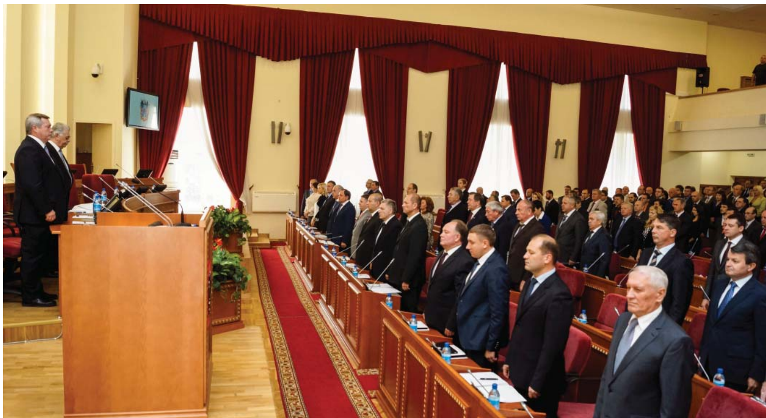
III Областной парламента обновился на половину, но вызовы и проблемы остались прежние.